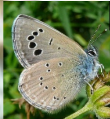
Azuré de la badasse