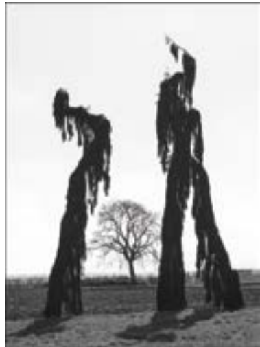
En couverture Danse des arbres de Jean Haas