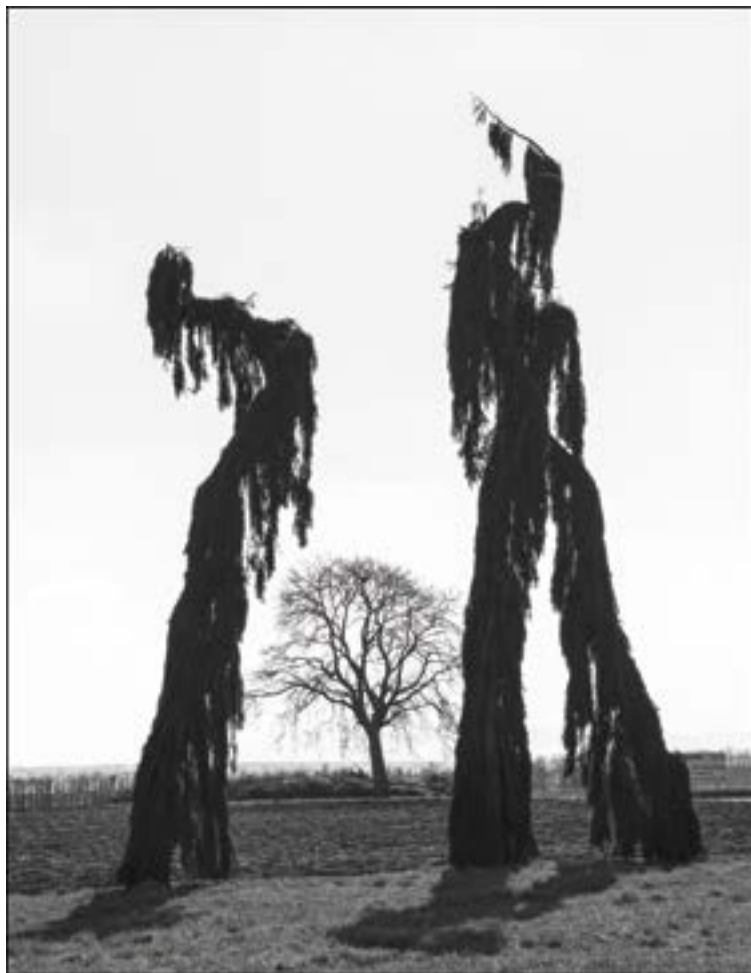
Brumath – Haguenau (Bas-Rhin) Cyrès pleureurs à proximité de la route.