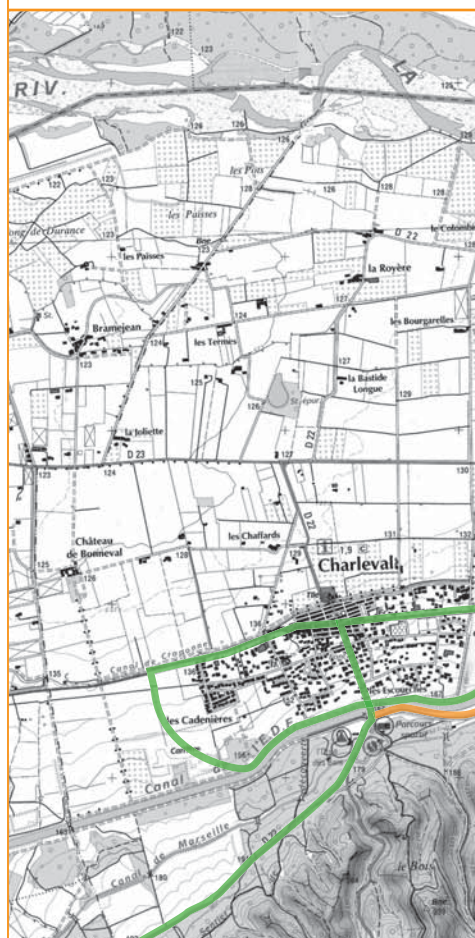
L'élargissement de la voie côté canal